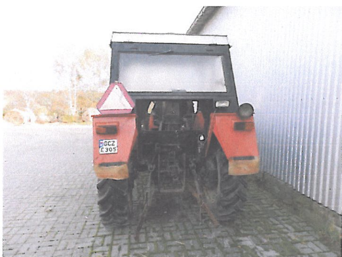
ZETOR 5011 Z KAB (7)