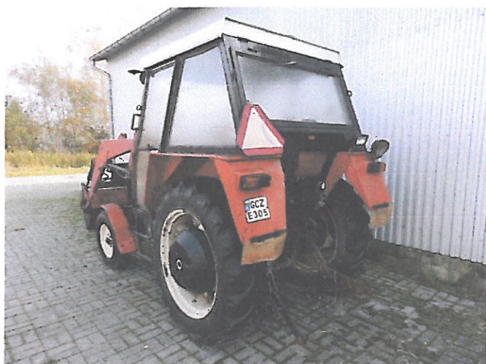
ZETOR 5011 Z KAB (5)