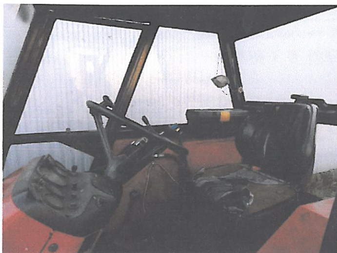
ZETOR 5011 Z KAB (11)