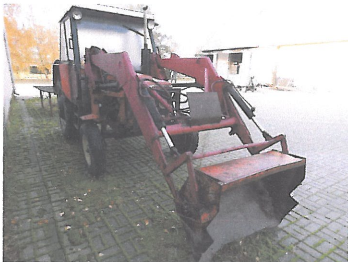
ZETOR 5011 Z KAB (3)