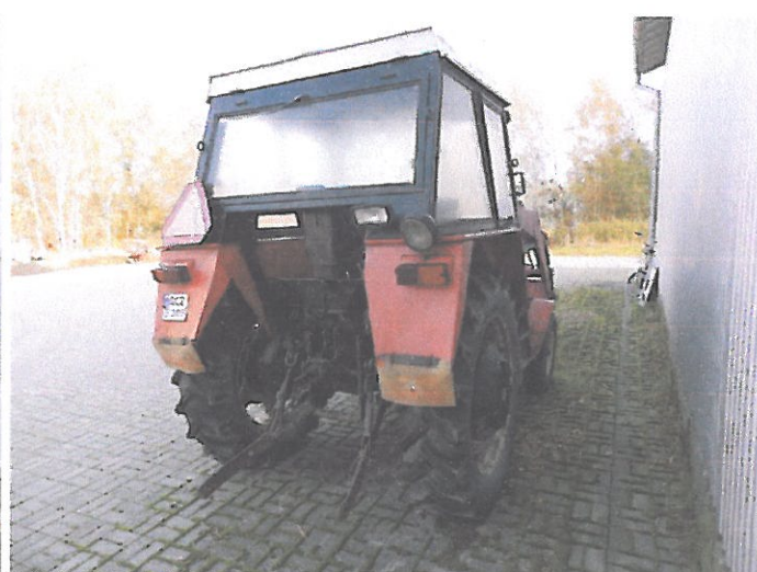
ZETOR 5011 Z KAB (8)