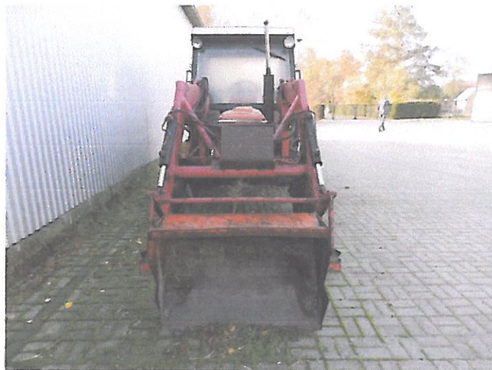
ZETOR 5011 Z KAB (1)