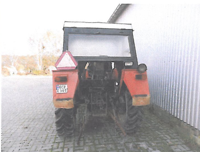
ZETOR 5011 Z KAB (6)