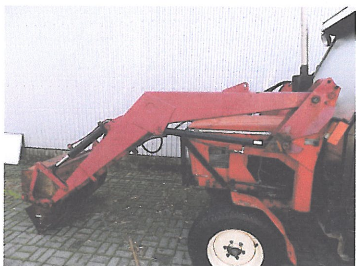
ZETOR 5011 Z KAB (9)