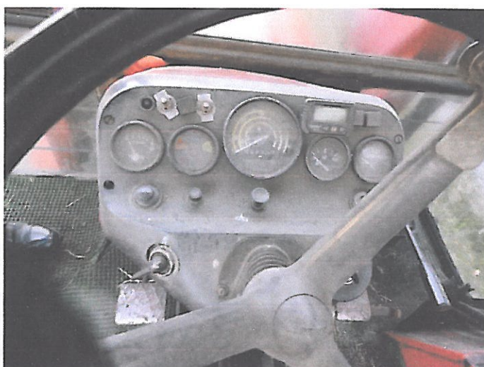
ZETOR 5011 Z KAB (12)