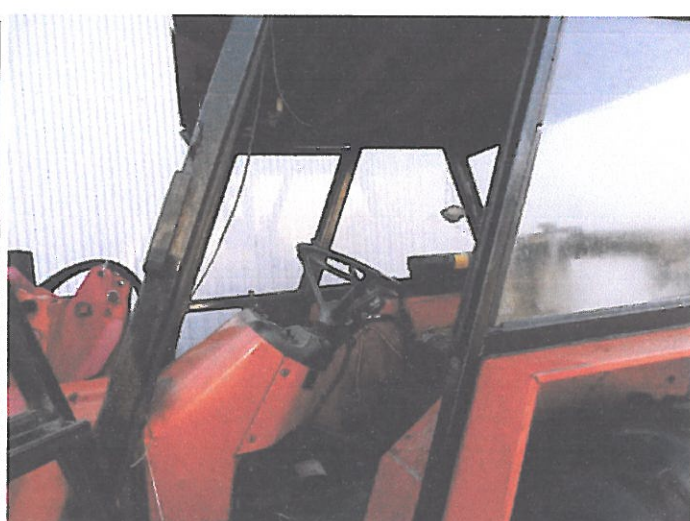
ZETOR 5011 Z KAB (10)