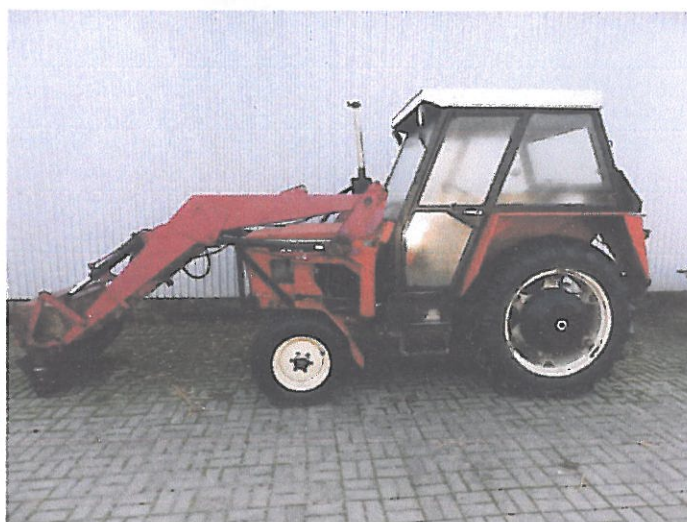
ZETOR 5011 Z KAB (4)