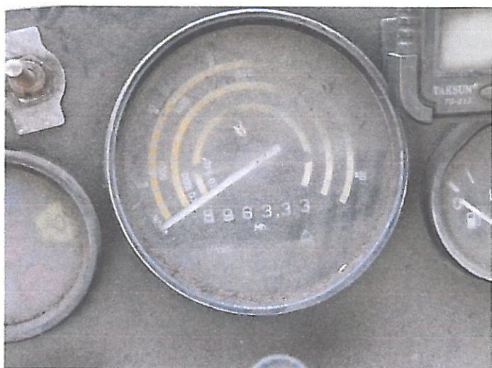
ZETOR 5011 Z KAB (13)