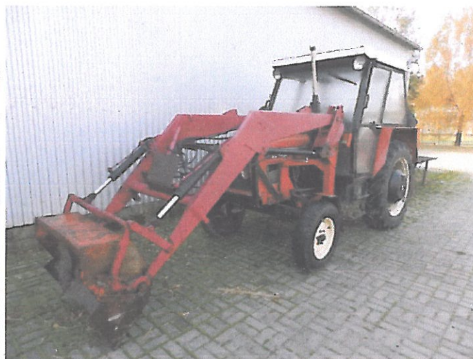
ZETOR 5011 Z KAB (2)