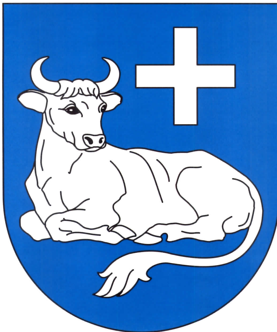
Rys. 1. – HERB GMINY CZŁUCHÓW 1