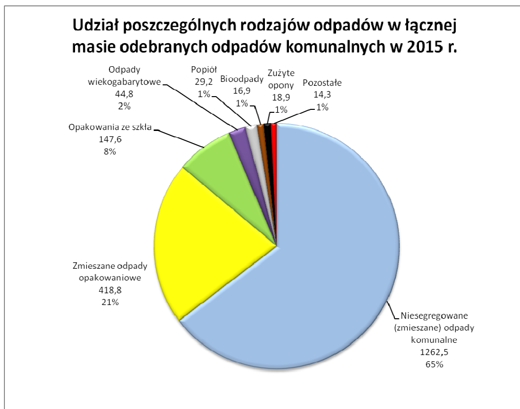
Ryc. 1. Udział poszczególnych rodzajów odpadów dostarczonych do ZZO Nowy Dwór sp. z o.o. w 2015 r.