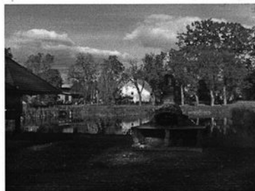
Rysunek 6 Wiejski plac rekreacyjny przy stawie