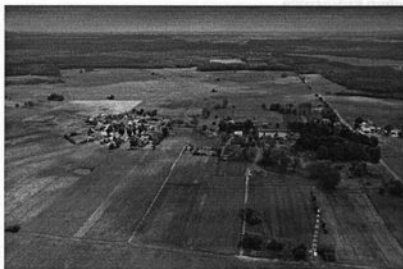
Rysunek 3 Stołczno z lotu ptaka