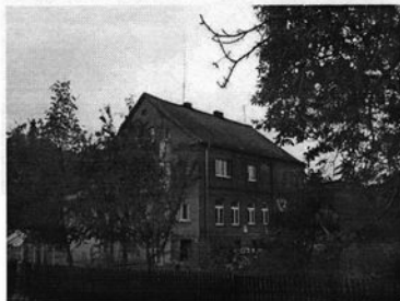
Rysunek 5 Budynek dawnego pałacu