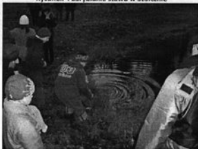
Rysunek 4 Zarybianie stawu w Stołcznie