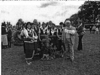
Rysunek 11 Przedstawicielki KGW na Dożynkach Gminnych 2010