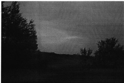
Rysunek 6 Jar w Dębнице