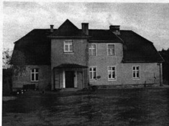
Rysunek 8 Dworek w Przytoku