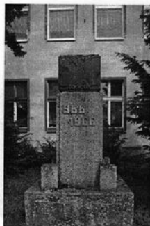
Rysunek 9 Zapomniany pomnik 1000-lecia