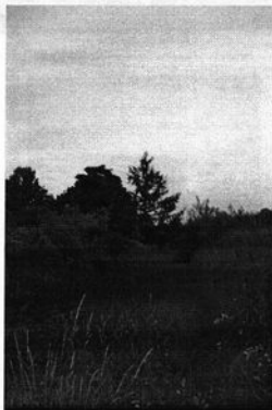
Rysunek 7 Wąwóz