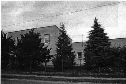
Rysunek 2 Były budynek szkoły i przedszkola