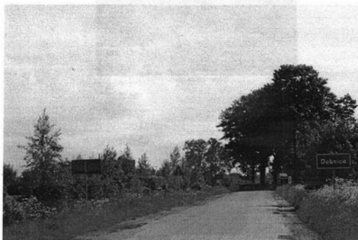
Rysunek 4 Wjazd do Dębница

Charakterystyczną cechą przestrzenną miejscowości Dębница jest jej położenie z zachowanym historycznym układem komunikacyjnym. Wieś charakteryzuje się dość zwartą zabudową wzdłuż drogi przebiegającej przez miejscowość. Wiele zabudowań należących do sołectwa Dębница znajdują się przy sadzie w Dębница. Część zabudowań pochodzi z okresu przedwojennego jednak większość budynków mieszkalnych i zabudowań gospodarczych została pobudowana w ostatnich 30 latach.