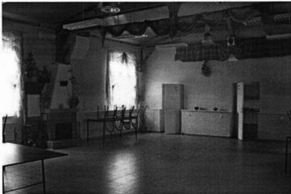
Rysunek 6 Wnętrze świetlicy wiejskiej