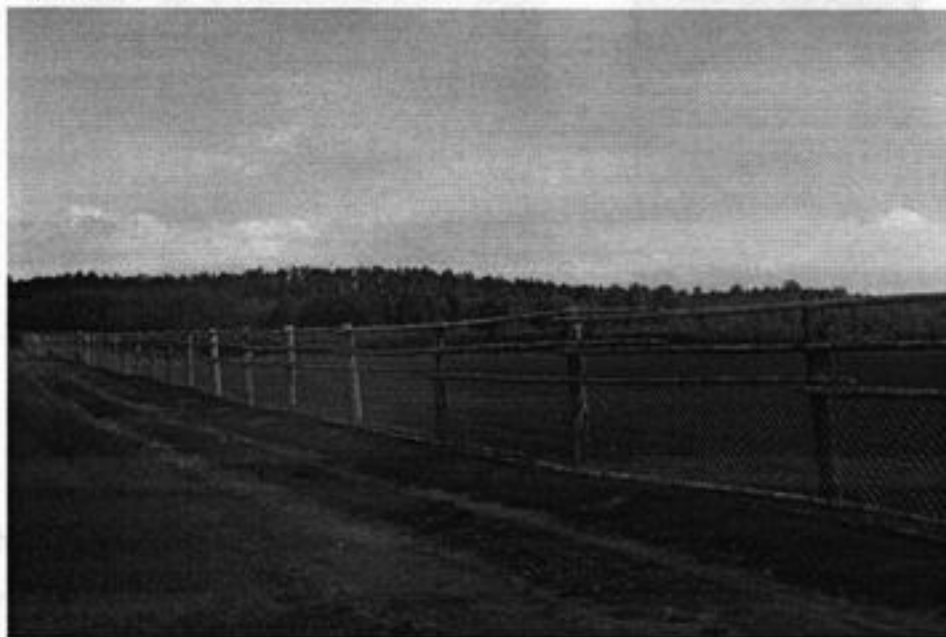
Rysunek 8 Zagroda rolnicza

pszenica, owies). Gospodarstwa te wykorzystują pomoce unijne i modernizują swój park maszynowy. Część najsłabszych gruntów przeznaczono do zalesienia. Jedno z gospodarstw zwiększa specjalizację i przygotowuje część swoich gruntów pod hodowlę zwierzyny być może danieli.