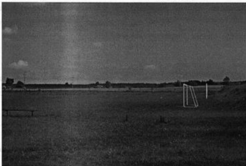
Rysunek 10 Boisko trawiaste

Jaromierz posiada boisko trawiaste do piłki nożnej, na którym miejscowa młodzież zagospodarowuje swój wolny czas. Wieś nie posiada drużyny piłkarskiej. Rozgrywane są tu zawody z okazji Dnia Dziecka a także odbywają się imprezy okolicznościowe.