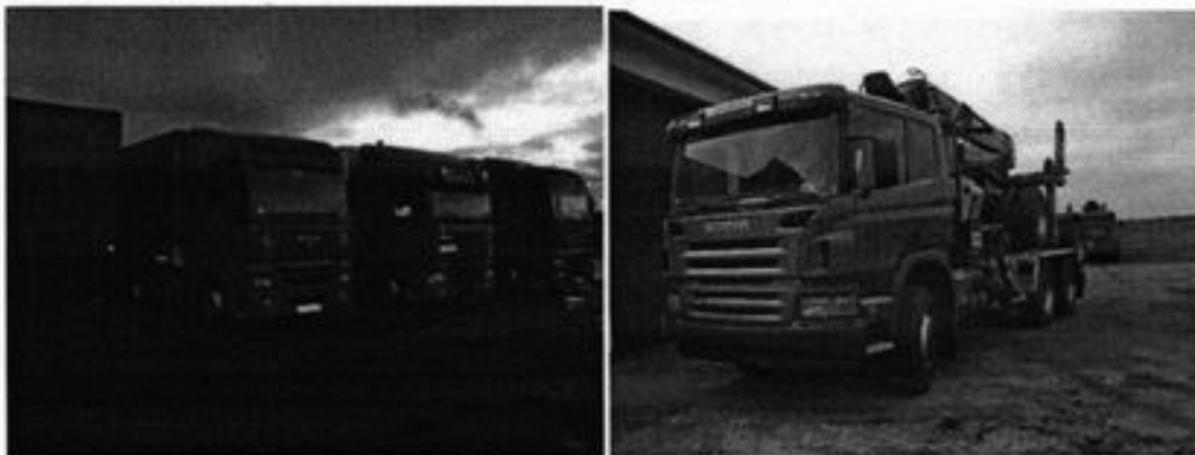
Rysunek 7 Samochody "TRANS-WOOD"

Teren sołectwa nie jest uprzemysłowiony. Działalność prowadzi 5 podmiotów gospodarczych. Największą firmą jest PPHU TRANS-WOOD która zajmuje się transportem międzynarodowym i specjalistycznym drewna.