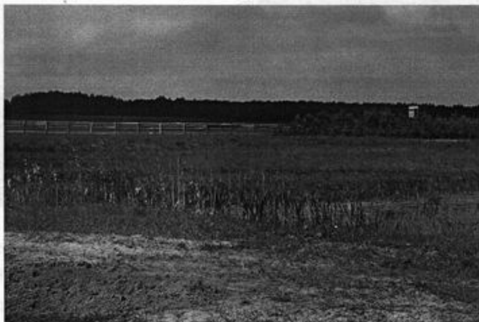
Rysunek 9 Pola wokół Jaromierza

Dane dotyczące rolnictwa przedstawiają się następująco: