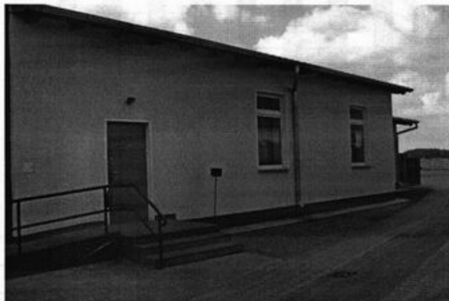
Rysunek 5 Świetlica wiejska w Jaromierzu

Organizacją działającą społecznie jest Koło Gospodyń Wiejskich skupiające 25 kobiet, które angażują się w przygotowywanie imprez na terenie sołectwa jak i również gminy: dożynki, Dzień Ziemiaka, Impreza Choinkowa, Dzień Kobiet. Miejscem w którym odbywa się szereg imprez jak i przygotowań jest świeżo wyremontowana świetlica wiejska.