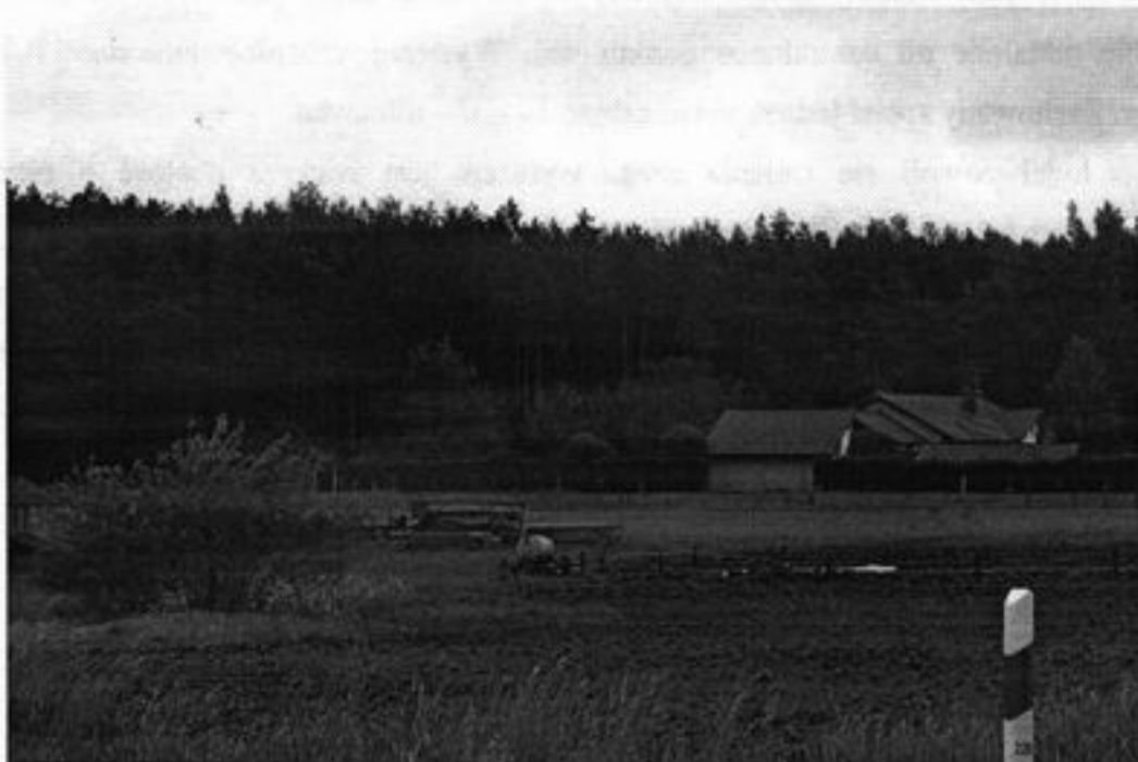
Rysunek 3 Lasy nieopodal Jaromierza to raj dla grzybiarzy oraz turystów

Wieś położona jest wśród dużej ilości lasów sosnowych. Lasy te są bogate w zwierzynę leśną i owoce runa leśnego co umożliwia czynną rekreację i wypoczynek.