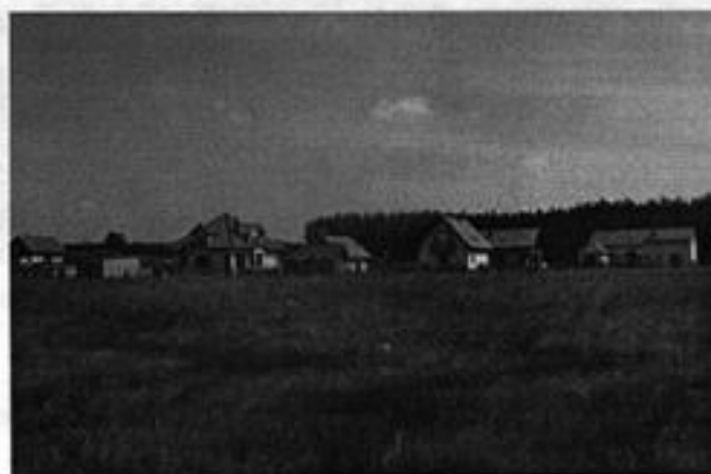
Rysunek 2 Widok na nowe osiedla we wsi Jaromierz

Na terenie sołectwa powstają nowe osiedla domków jednorodzinnych. Bliskie położenie wsi od miasta Człuchowa sprawia, że ludzie szukając spokoju przeprowadzają się na tereny spokojnej i urokliwej wsi.