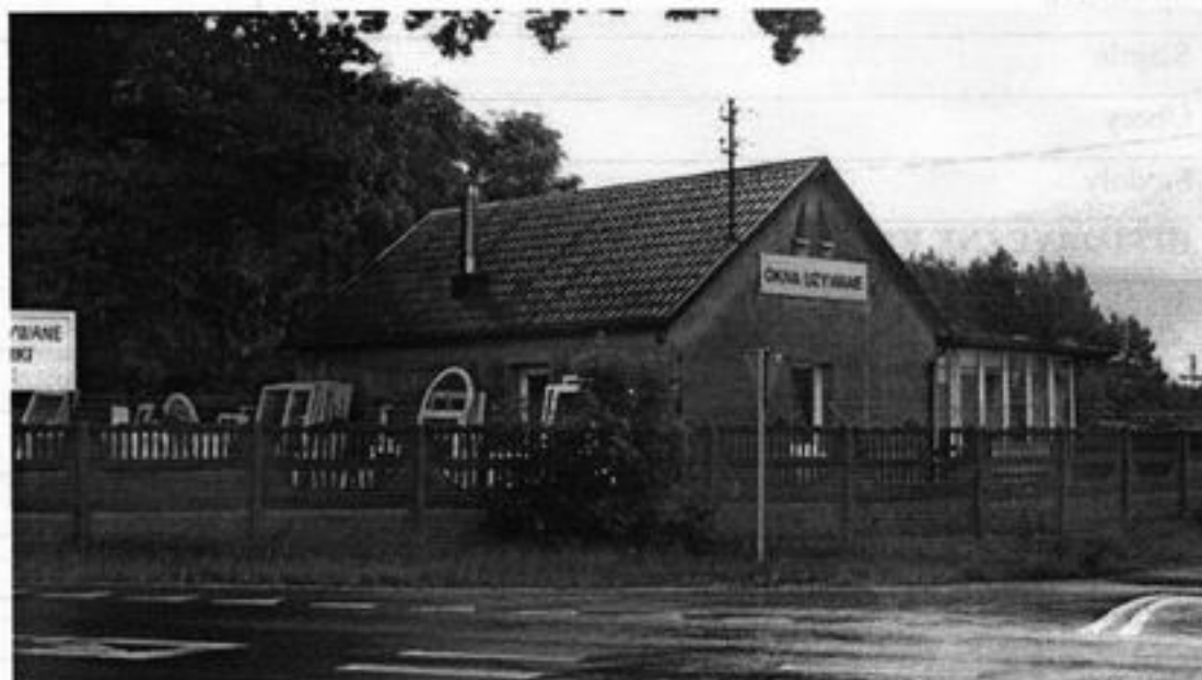
Rysunek 4 Budynek po byłej kuźni

Obiektem przewidzianym do wpisu rejestru zabytków jest nieczynny cmentarz ewangelicki poł. XIX w.