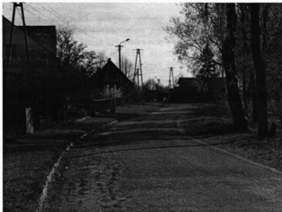
Rysunek 2 Droga powiatowa wzdłuż miejscowości