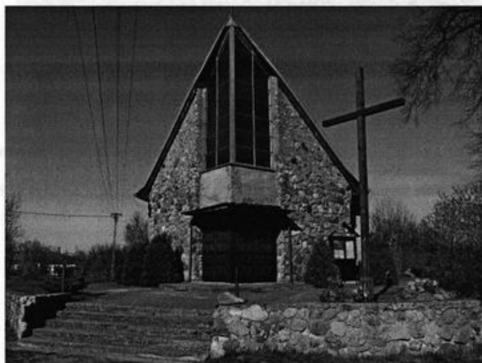
Rysunek 4 Kościół filialny w Brzeźnie