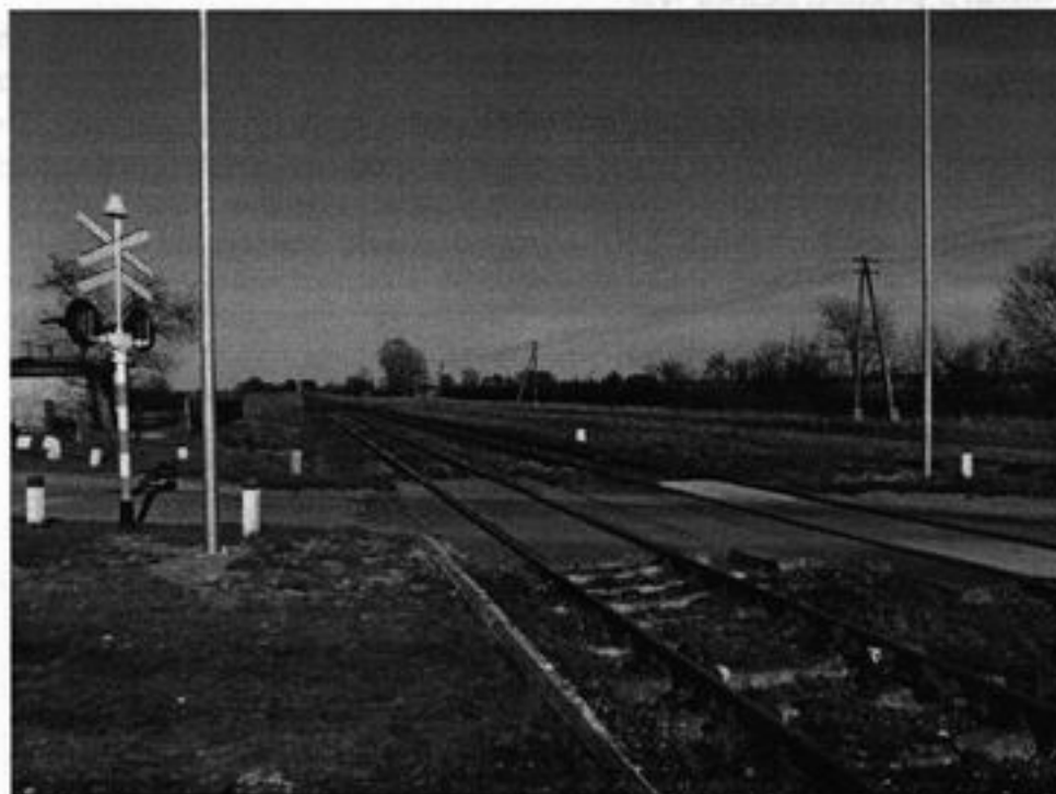
Rysunek 3 Trasa kolei Człuchów - Chojnice