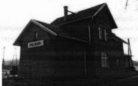
Rysunek 12 Budynek stacji kolejowej.

Przez naszą miejscowość przebiega linia kolejowa Człuchów – Miastko. Obecnie funkcjonuje jako linia kolejowa do transportu towarowego ze względów ekonomicznych zamknięto przewozy osobowe. Większość komunikacji i transportu oparta jest na transporcie drogowym. Komunikacja zbiorową zajmuje się PKS Człuchów. Wielu mieszkańców korzysta z własnych środków lokomocji