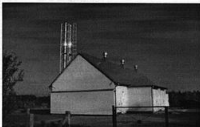
Rysunek 11 Kotłownia na słomę przy szkole w Polnicy

Budynki szkolne a także hala sportowa zasilane są ciepłem z nowo powstałej kotłowni na słomę.