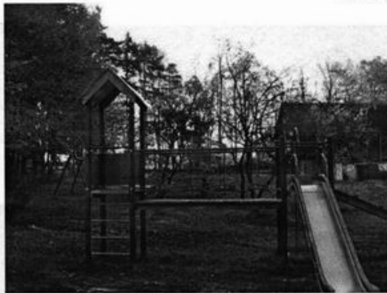
Rysunek 14 Plac zabaw.

Na placu w centrum wioski usytuowany jest plac zabaw dla małych dzieci gdzie najmłodszy mieszkańcy naszej miejscowości pod opieką rodziców mogą na świeżym powietrzu spędzać bezpiecznie czas.