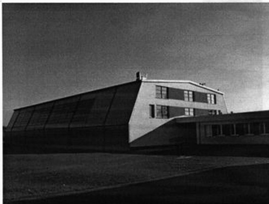
Rysunek 16 Hala sportowa

Przy szkole usytuowana jest pełnowymiarowa hala sportowa głównie do ćwiczeń ogólnorozwojowych i boisko sportowe. Bazę szkolną stanowią dwa budynki: pierwszy wybudowany w latach sześćdziesiątych przy którym usytuowana jest nowa hala sportowa dla potrzeb kształcenia młodzieży w zakresie kultury fizycznej i drugi budynek tzw. stara szkoła z lat trzydziestych, która nie jest obecnie wykorzystywana. Budynki szkolne są w dobrym stanie technicznym.