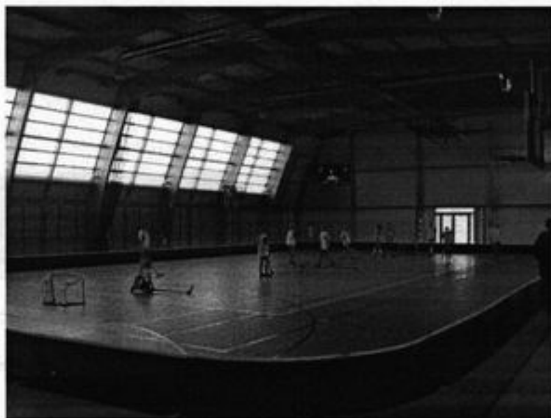
Rysunek 17 Hala sportowa

W naszej miejscowości działa przedszkole samorządowe do którego uczęszcza 20 przedszkolaków.