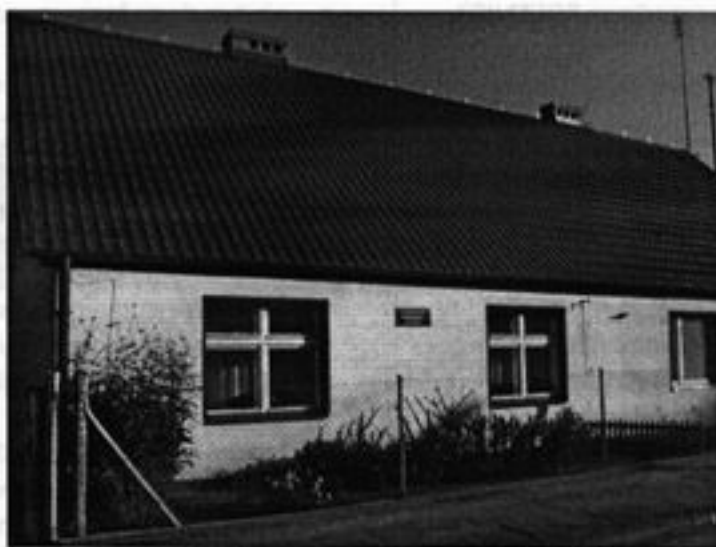
Rysunek 18 Budynek przedszkola

W naszej miejscowości działa przedszkole samorządowe do którego uczęszcza 20 przedszkolaków.