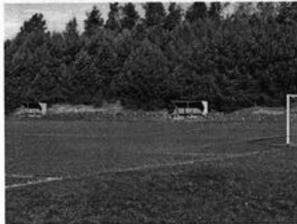
Rysunek 13 Trawiaste boisko sportowe w Polnicy

Nasza bazą do uprawiania sportu są boisko do piłki nożnej i piłki siatkowej, na którym miejscowa młodzież zrzeszona w klubie sportowym „Zefir” rozgrywa swoje zawody sportowe.