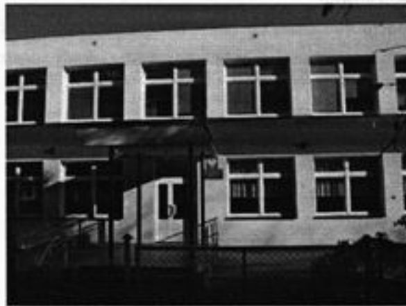
Rysunek 15 Budynek szkoły

Przy szkole usytuowana jest pełnowymiarowa hala sportowa głównie do ćwiczeń ogólnorozwojowych i boisko sportowe. Bazę szkolną stanowią dwa budynki: pierwszy wybudowany w latach sześćdziesiątych przy którym usytuowana jest nowa hala sportowa dla potrzeb kształcenia młodzieży w zakresie kultury fizycznej i drugi budynek tzw. stara szkoła z lat trzydziestych, która nie jest obecnie wykorzystywana. Budynki szkolne są w dobrym stanie technicznym.