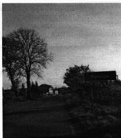
Rysunek 2 Droga główna przebiegająca przez Polnicę

Charakterystyczną cechą przestrzenną miejscowości Polnicy jest jej położenie z zachowanym historycznym układem komunikacyjnym. Wieś charakteryzuje się dość zwartą zabudową wzdłuż dróg przebiegających przez miejscowość. Wiele zabudowań pochodzi z okresu przedwojennego jednak większość budynków mieszkalnych i zabudowań gospodarczych została pobudowana na przestrzeni ostatnich lat.