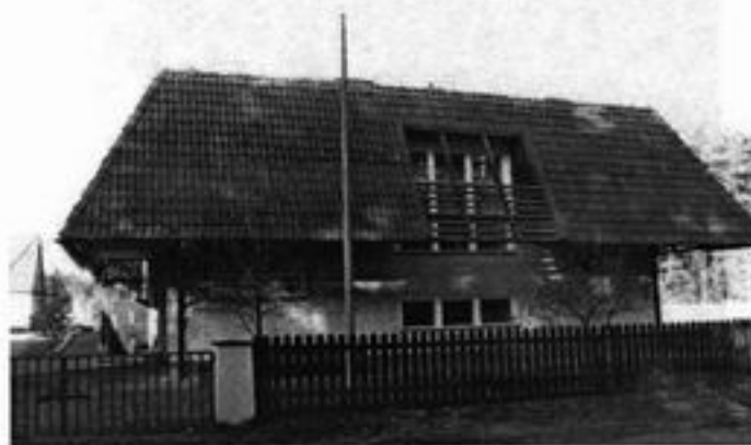
Rysunek 1 Budynek hospicjum w Starej Rogoźnicy

W pobliskiej Starej Rogoźnicy powstał ośrodek wczasowy a w ostatnich latach na istniejącej bazie zostało zlokalizowane tam hospicjum.