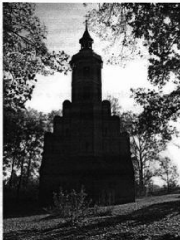
Rysunek 3 Kościół neogotycki p.w. św. Józefa z 1901r.,

Wieś położona jest w lekkim zagłębieniu terenu. Cechą charakterystyczną i dominującą naszej miejscowości są dwa kościoły.