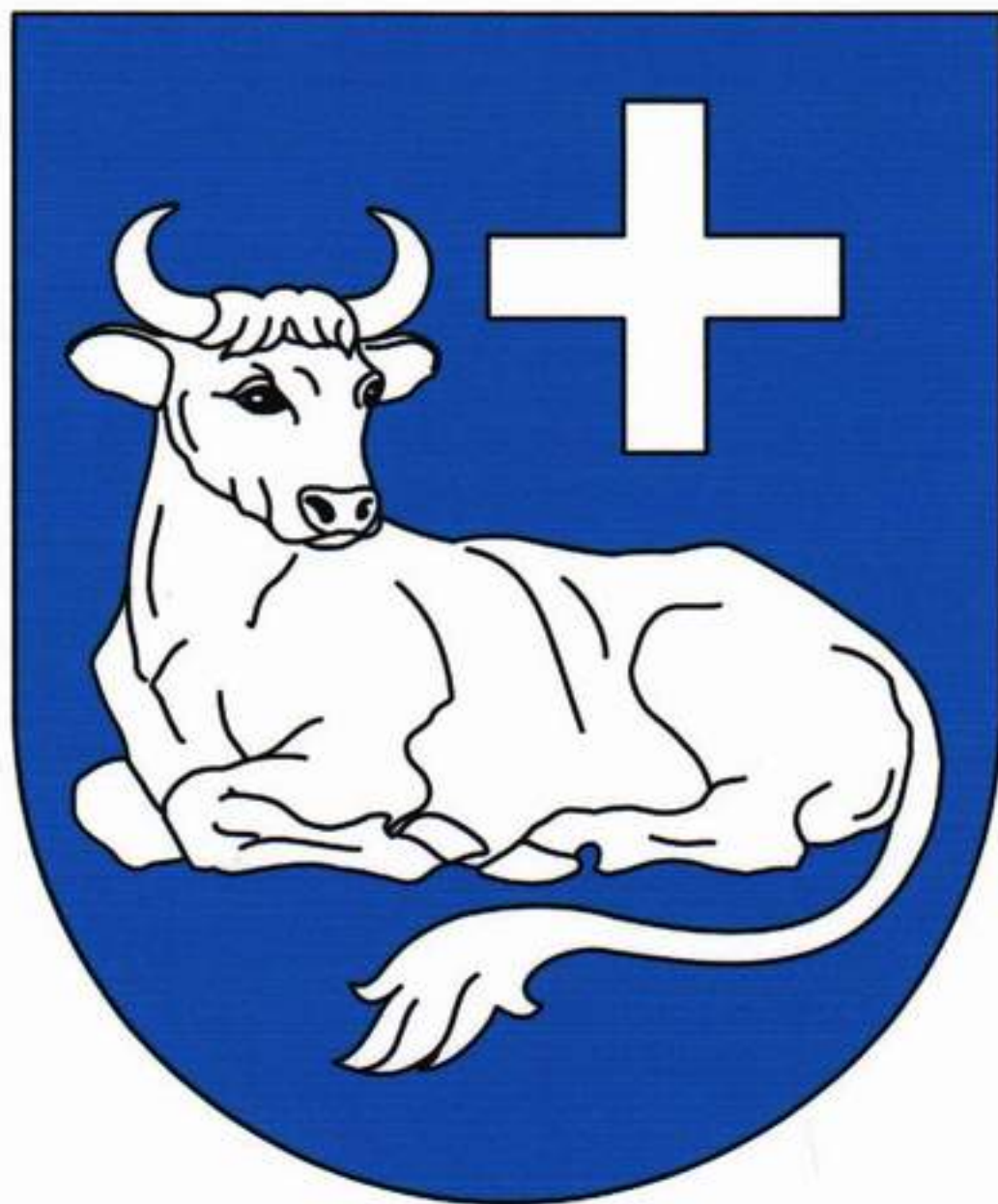
HERB GMINY CZŁUCHÓW

Załącznik Nr 1 do uchwały Nr XXIV/190/08 Rady Gminy Człuchów z dnia 29.12.2008